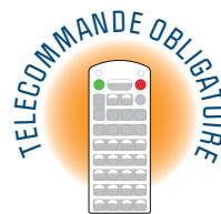
Télécommande non incluse