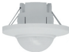
Ø encastrement : 65 mm

DÉTECTEUR DE MOUVEMENT. Ce produit utilise des capteurs de haute sensibilité. Il rassemble l'automatisme, la sécurité pratique, l'économie d'énergie et les fonctions pratiques. Il utilise l'énergie infrarouge de l'homme comme source du signal, il peut démarrer la charge quand on entre dans le champ de détection. Il peut identifier le jour et la nuit automatiquement. Il est facile à installer afin d'être largement utilisable.